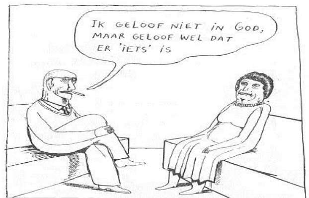
CITEERDE WIM DE HALVE WERELDBEVOLKING

18 dag en nacht aan te geven en het donker van het licht te scheiden. God zag dat het goed was.